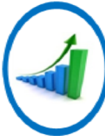
ความมั่งคั่ง